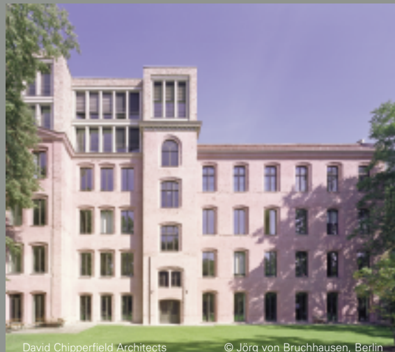
David Chipperfield Architects