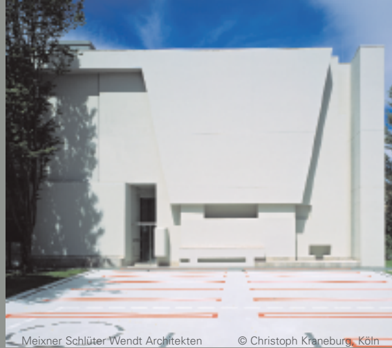
Meixner Schlüter Wendt Architekten